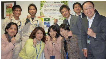
労働組合 厚生部 人事部 健康管理センター 一同

学習を通じて「働き方」について、ご自身や職場の仲間と見直したり、 考えるきっかけになれば幸いです。